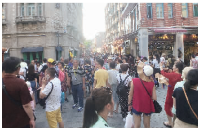
端午假期,鼓浪屿上游客如织。 P186184033

除了端午民俗活动外,乐园玩水、海边漫步、扬帆出海等成了游客最爱的项目。端午期间,观音